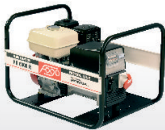
FH 6000 R