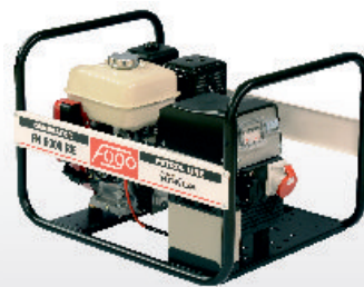
FH 6000 RE