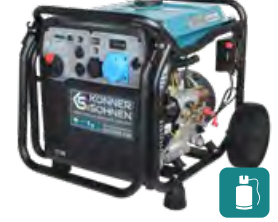
KS 8100iEG ATSR