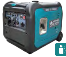
KS 5500iEG S