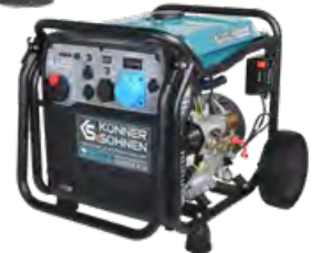
KS 8100iE ATSR