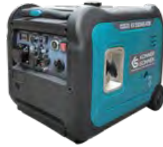
KS 5500iES ATSR