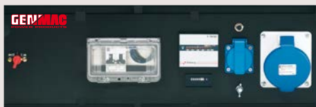
QFPM-OS-PM4 / QFPM-PB-PM4