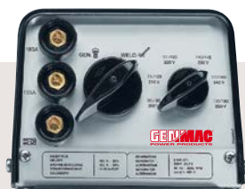
201R / 181KE