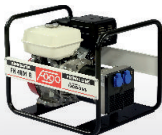
FH 4001 R