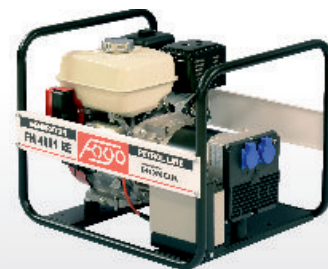
FH 4001 RE