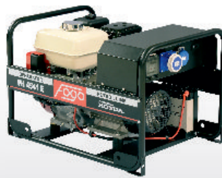
FH 4541 E