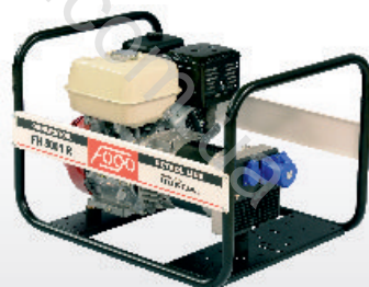
FH 5001 R