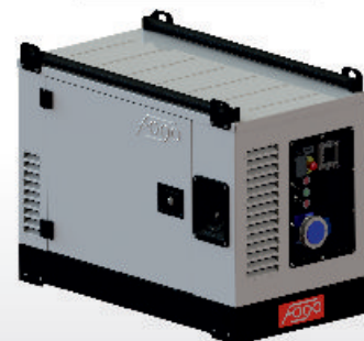
FH 6001 RCEA