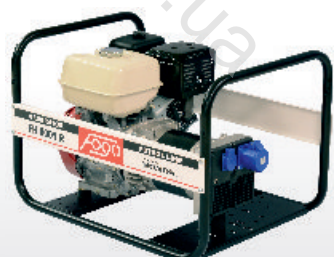
FH 6001 R