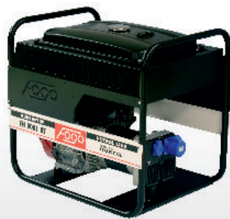
FH 6001 T / RT