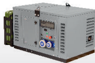
FH 6001 RCE