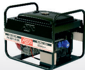
FH 6001 RTE / RTEA