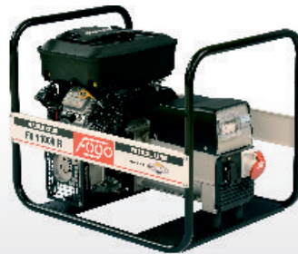
FV 11000 R.