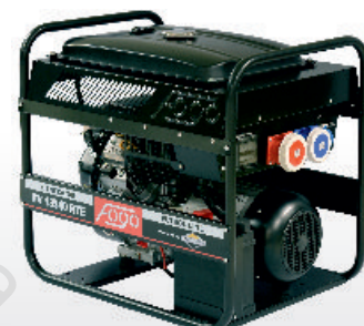
FV 13540 RTE / RTEA