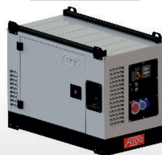
FV 13000 RCEA