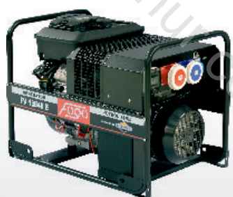
FV 13540 E