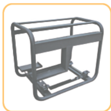
Потужна стальна рама 28 мм